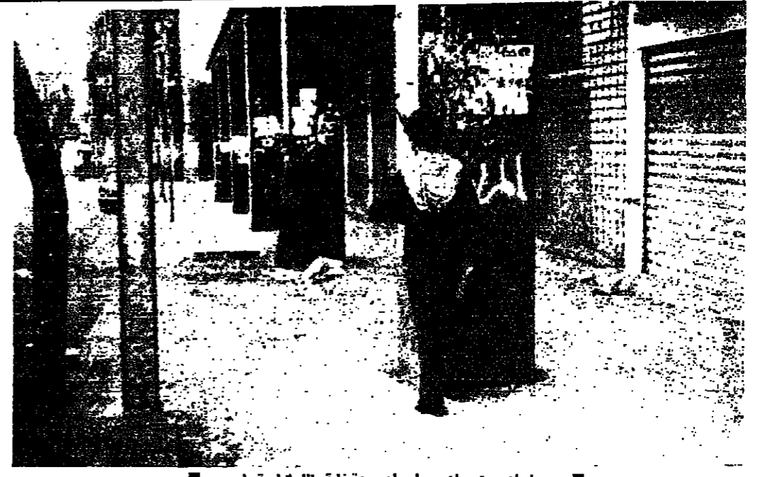
مجلسان يترسان وراء اعمدة قبة المارونية امس